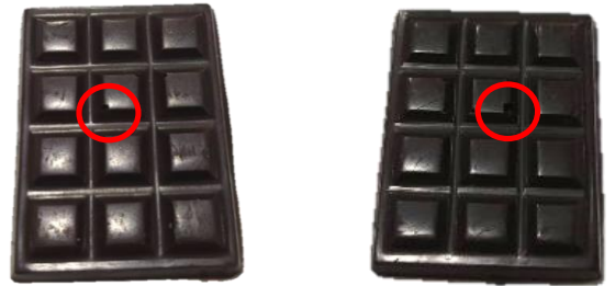
ช็อกโกแลตมีฟองอากาศขนาดน้อยกว่า 3 มม. และ/หรือ ไม่เกิน 2 จุดต่อชิ้น