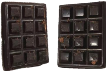
ช็อกโกแลตมีเส้นใย / ลายเป็นจำนวนมาก