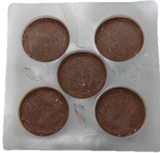
พบรอยเปื้อนของเจลไฮโดรเจลและมูสที่ถาดมูสเค้ก