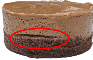
พบรอยแตก / รอยแยก ของชั้นฐานเค้กช็อกโกแลตกับชั้นมูสช็อกโกแลต