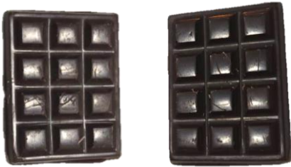
ช็อกโกแลตมีฝ้า / ลายเล็กน้อย