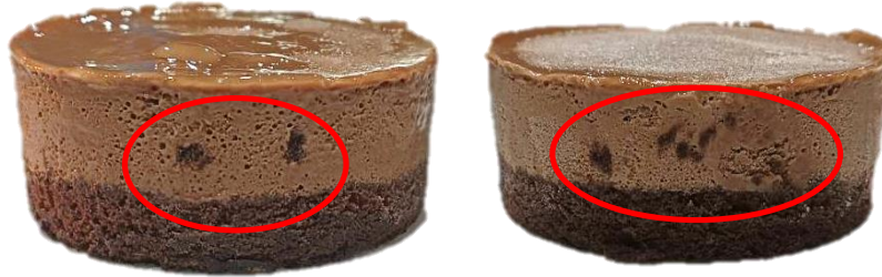
พบรอยเปื้อนของสปองจ์ช็อกโกแลตบนชั้นมูสช็อกโกแลต