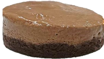
มูสเอียงมากกว่า 1 ซม.