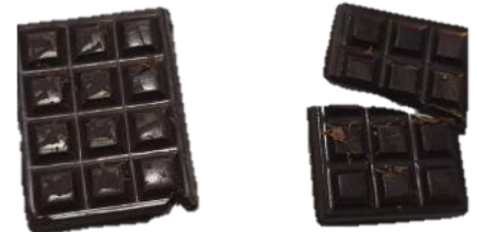
ช็อกโกแลต / แตกหัก / ไม่สมบูรณ์