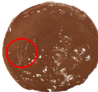
หน้าของสินค้าไม่เรียบเล็กน้อย