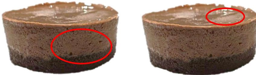
รูขนาดเล็ก ไม่เกิน 1 ซม. (เช่น ฟองอากาศ และอื่น ๆ)