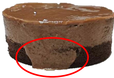
มูสไหลถึงฐานเค้ก