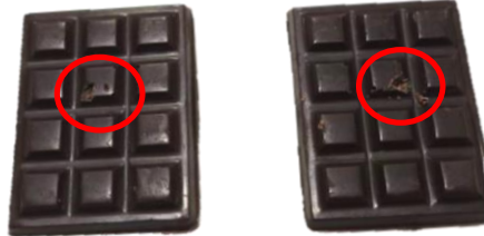
ช็อกโกแลตมีฟองอากาศขนาดมากกว่า 3 มม. และ/หรือ เกิน 2 จุดต่อชิ้น