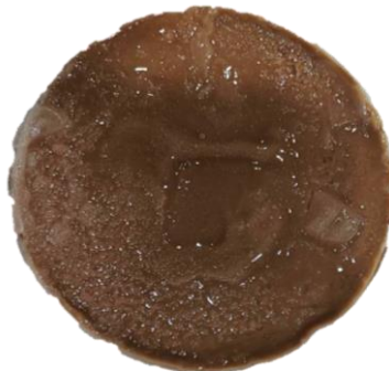
หน้าของสินค้าไม่เรียบจากเจลใสแต่งหน้าเค้ก