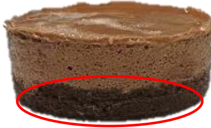
สปองจ์ชีกโกแลตมีรอยแยก / รอยแตก