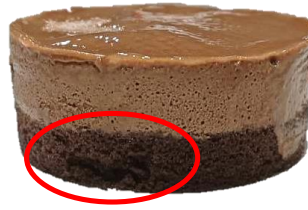
ฐานสปองจ์ช็อกโกแลตแห้งขนาดมากกว่า 1 ซม.