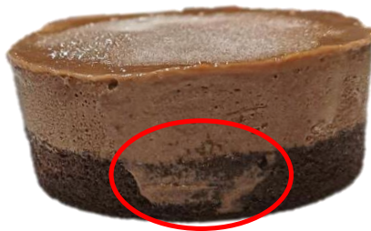
พบมูสช็อกโกแลตบนฐานชั้นสปองจ์ช็อกโกแลต